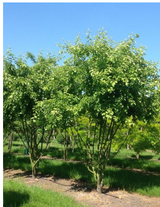
Malus Everreste in der Baumschule