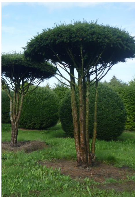
Taxus baccata als Schirmform