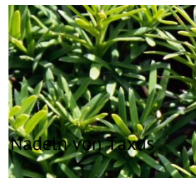
Nadeln von Taxus