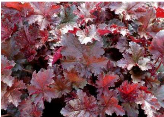
Heuchera Chocolate Ruffles Blüte: weiss Grösse: 35 cm Blütenzeit: 7-8 Blatt: rotbraun, gelappt