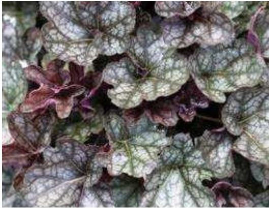
Heuchera Regina Blüte: rosa Grösse: 40 cm Blütenzeit: 6-8 Blatt: rot, weiss marmoriert