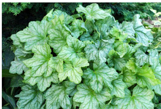
Heuchera Mint Julep