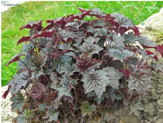
Heuchera mic. Palace Purple