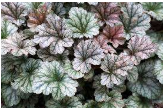
Heuchera Pewter Moon