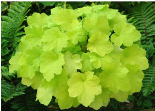
Heuchera Citronelle Blüte: weiss Grösse: 30 cm Blütenzeit: 7-8 Blatt: zitronengelb