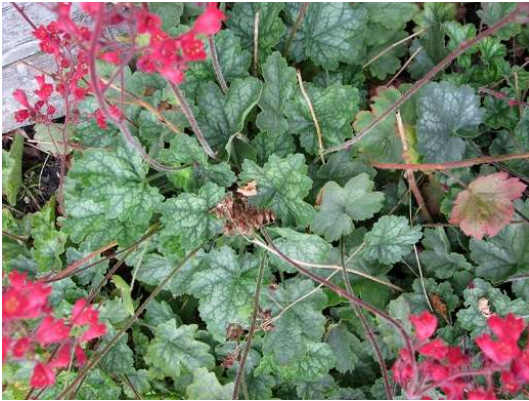
Heuchera briz. Leuchtkäfer Blüte: rot Grösse: 40 cm Blütenzeit: 6-8 Blatt: grün/weiss