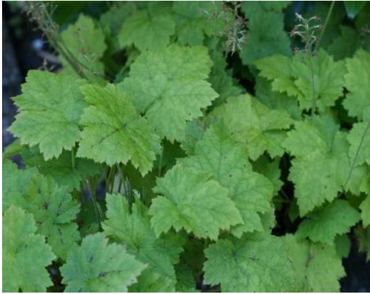
Tiarella cordifolia Blüte: weiss Grösse: 20 cm Blütenzeit: 4-5 Blatt: grün