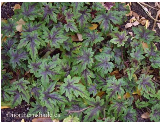
Tiarella Sugar ans Spice Blüte: weiss Grösse: 20 cm Blütenzeit: 4-5 Blatt: gezackt mit rotbrauner Mitte