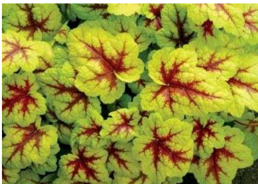
Heucherella Stoplight Blüte: weiss Grösse: 40 cm Blütenzeit: 6-8 Blatt: gelb, rot geadert