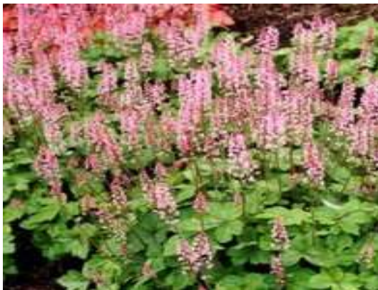
Heucherella tiarelloides Blüte: rosa Grösse: 30 cm Blütenzeit: 5-6 Blatt: grün, gelappt