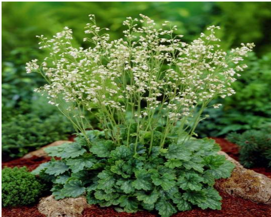
Heuchera sanguinea ‚White Cloude‘ Blüte: weiss Grösse: 50 cm Blütenzeit: 5-6 Blatt: grün