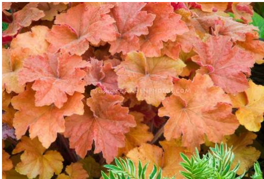
Heuchera Caramel Blüte: weiss Grösse: 40 cm Blütenzeit: 6-7 Blatt: bernsteinfarbig