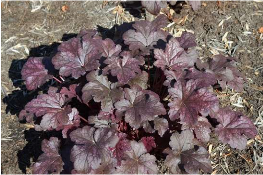
Heuchera Plum Pudding Blüte: grün, weiss Grösse: 50 cm Blütenzeit: 7-8 Blatt: rot, rund, gewellt