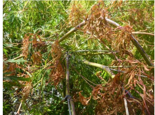
typische Welke einzelner Äste

Die Triebwelke ist ein Bodenpilz der oft latent im Boden vorhanden ist und ihn über Jahre hinweg verseuchen kann. Verticillium ist ein Pilz der in den Leitungsbahnen lebt und diese immer mehr verschliesst.